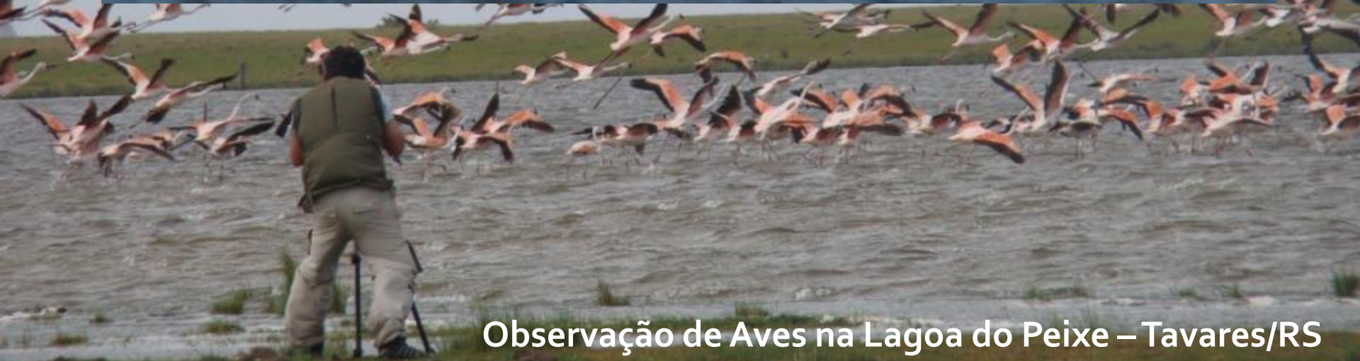
Observação de Aves na Lagoa do Peixe – Tavares/RS