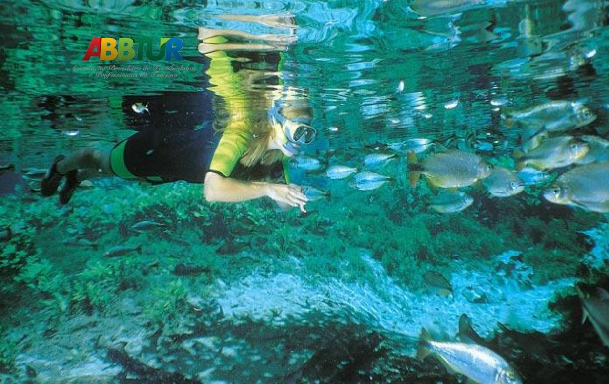
Imagem do Destino é permanentemente trabalhada!