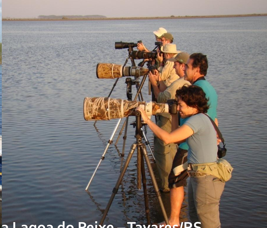
Observação de Aves na Lagoa do Peixe – Tavares/RS